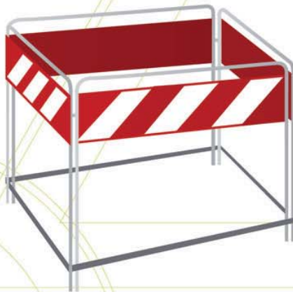
BARRIERA DI RECINZIONE PER CHIUSINI Dimensioni cm 100 x 100 x 100h Disponibile anche con gambe pesanti