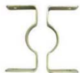
staffa sostegno bifacciale

I sostegni sono realizzati in tubolare \emptyset mm. 48/60/90 in ferro zincato a caldo secondo le norme UNI, lisci o con dispositivo antirotazione. Su questi ultimi viene ricavata su tutta la lunghezza una scanalatura che garantisce l'antirotazione del segnale rispetto al sostegno. Alla sommità viene applicato un tappo in PVC.