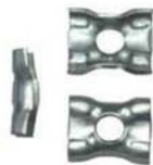
sostegno a farfallina